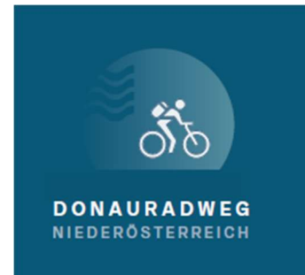
Abbildung 2: Signet Donauradweg Niederösterreich (Entwicklung ist noch nicht abgeschlossen)

In Summe sorgt das neue Signet dafür, dass der Donauradweg als zusammenhängendes, professionell betreutes Tourismusprodukt wahrgenommen wird – von Enns bis Hainburg und quer durch ganz Niederösterreich.