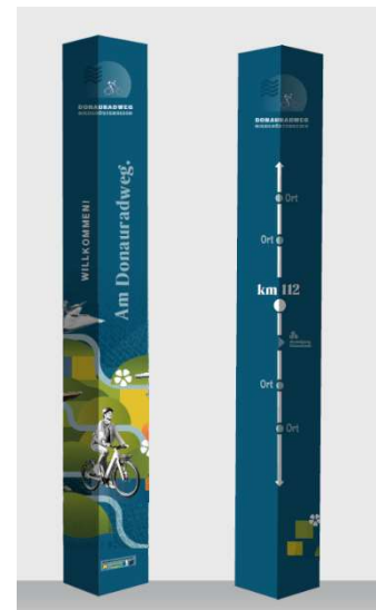
Abbildung 3: Entwurf große Säule