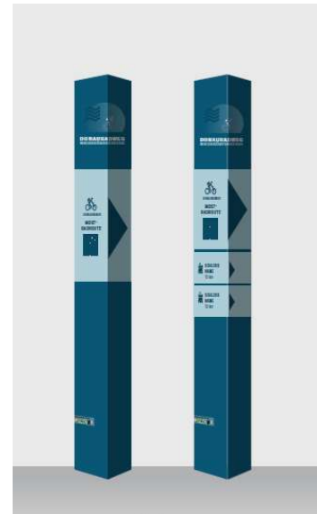
Abbildung 4: Entwurf kleine Säulen